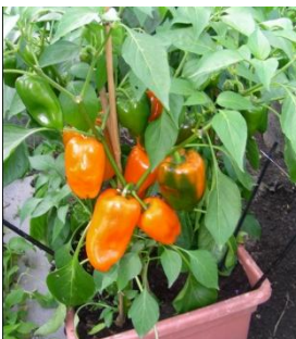
Daisy im Container